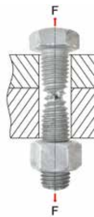
Prov av lämplighet av skruv med tillhörande mutter till icke förspända förband enligt EN 15048-2.

En av Europas största skruvgrossister har valt denna väg för att med säkerhet kunna försöka marknaden med kvalitativa produkter. Den svenska marknaden borde ställa samma krav på sina leverantörer av fästelement och infästningar till stålbyggnadsmarknaden. Borde det då inte räcka med att företaget har köpt in produkten med ett 3.1 certifikat enligt EN 10204:2004? Svaret är ett klart nej! I många fall har skruvgrossisten köpt in produkterna via en annan grossist eller ett handelshus utan egenkontroll eller i vissa fall från en fabrik som han inte har gjort en leverantörsbedömning av. I en del fall så stämmer inte ens certifikatet överens med den produktbatch som levererats.