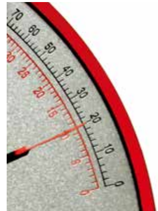
Uppfyller ej kravet på 27 Joule vid minus 20^{\circ}\text{C} .

skruv med tillhörande mutter enligt EN 15048-2. Min brottlasten är ett krav för korrekt CE märkning.