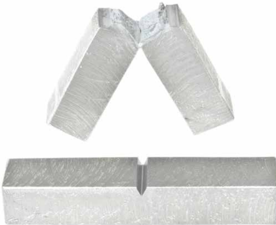
Slagseghetsprov Charpy V vid -20^{\circ}\text{C} .